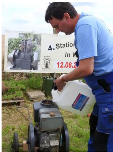
Ein Motor mit Verdampferkühlung wird für den Start vorbereitet

So ein Treffen dient nicht nur der bloßen Ausstellung von historischen Motoren, nein, sie sollen auch in Funktion vorgeführt werden. Wenn so eine alte Maschine in einem Stall, einer Scheune oder auf einem Schrottplatz entdeckt wurde, besteht die Herausforderung für den Technikbegeisterten darin, sie wieder zum Laufen zu bringen. Meist fehlen dann lebenswichtige Teile für Steuerung, Zündung oder Kraftstoffzufuhr. Sie werden in langwieriger Suche im Internet und bei ähnlichen Treffen beschafft. In schweren Fällen zeigen sich auch Risse im gusseisernen Gehäuse, dann muss geschweißt werden.