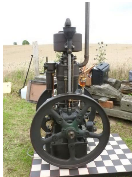
Dieser Deutz-Viertakt-Ottomotor vom Typ MA608 wurde von Peter Gosemann gezeigt. Er hat mit einer Bohrung von 70 mm und einem Hub von 80 mm einen Hubraum von 308 cm 3 und leistet 4 PS bei 2000 Umdrehungen. Die Kühlung erfolgt durch Verdampfung. Dieser Motor wurde in großen Stückzahlen gebaut: rund 55.00 Stück wurden von 1931 bis 1954 hergestellt. Das ausgestellte Exemplar trägt die Nr. 42705. 5