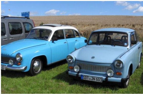
Obwohl das Stationärmotortreffen kein Fahrzeugtreffen war, waren auch einige Oldtimer ange-reist, hier ein Wartburg 311 und ein Trabant 601.