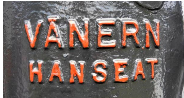
Der hier gezeigte Motor Vänern Hanseat wurde von der Firma Fr. Sternemann & Co. Hamburg als Lizenzbau hergestellt. Der Motor leistete 6 PS bei 650 Umdrehungen. Er war auf einem Schubkahn auf der Peene als Kranmotor eingesetzt.