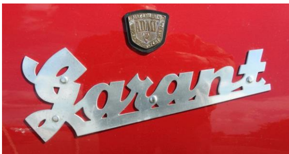
Dieser hervorragende restaurierte LKW „Garant 30K“ (Baujahr etwa 1952) war ursprünglich ein Vorläufermodell „Granit“ und wurde 1957 auf den neuen Typ „Garant“ umgebaut.