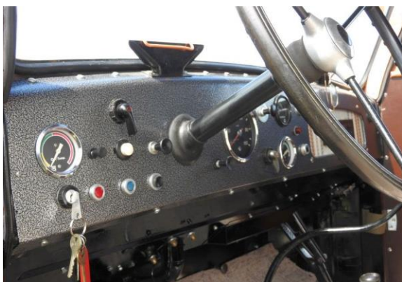
Blick in die Fahrerkabine des „Garant 30 K“