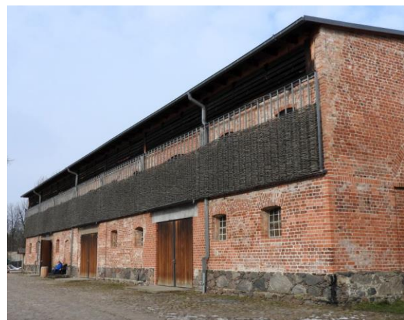
Das Besucherzentrum in Criewen befindet sich in einem ehemaligen Speicher.