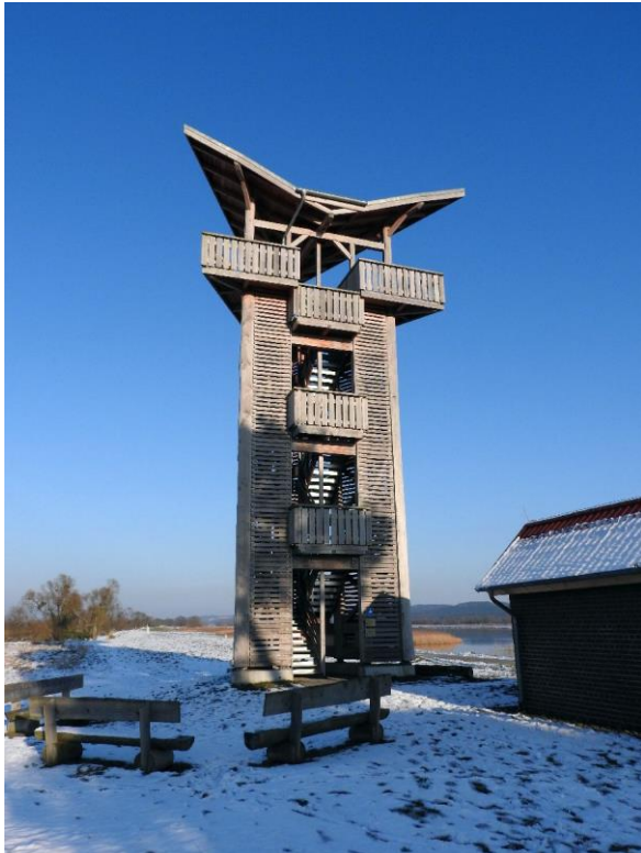
Das Dach des Beobachtungsturms bei Stützkow erinnert an die Schwingen des Kranichs.

Neben diesen wirtschaftlichen Aspekten sind die Polder aber vor allem ein Refugium für die Pflanzen- und Tierwelt. 284 Vogelarten werden hier gezählt, darunter Schreiadler, Kranich und Schwarzstorch. Im Frühjahr und im Herbst, zur Zeit der großen Vogelwanderungen, finden sich hier bis zu 15.000 Kraniche ein. Selbst im Winter lohnt sich ein Besuch des Nationalparks, denn die gelbschnäbligen, aus Skandinavien und Sibirien kommenden Singschwäne machen im Herbst die Reise der anderen Vögel in Richtung Süden nicht weiter mit. Sie überwintern hier und erfüllen die Luft von Zeit zu Zeit mit ihren posauenähnlichen Rufen.