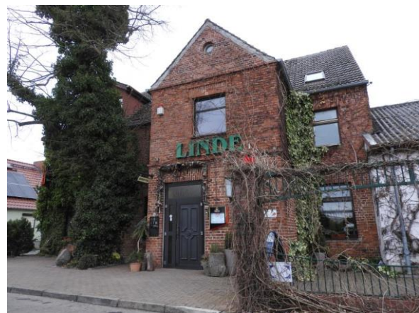
Im Gasthof „Linde“, unweit des Besucherzentrums, können Rad- und Fußwanderer gut essen.