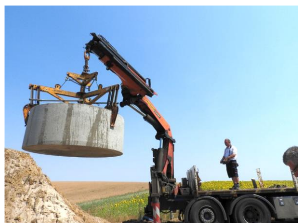
Zuerst wird das Behälterunterteil mit dem LKW-Ladekran in die Grube gesetzt.