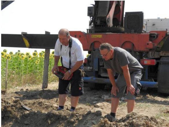
Beim Setzen der Ringe war Präzisionsarbeit nötig.