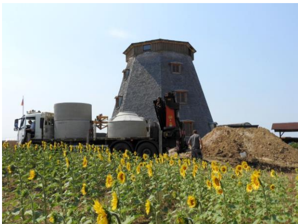
Anlieferung der Behälterringe

Nun sind noch einige kleinere Arbeiten notwendig, wie die Anlage eines Weges zum Toiletten-Container. Auch die Abnahme durch die ZOWA steht noch aus. Das sind aber kleine Fische im Vergleich zu dem, was die Vereinsmitglieder (nicht alle konnten hier namentlich genannt werden) in den letzten Wochen geleistet haben.