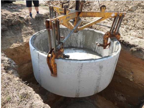
Der Behälter hat einen Durchmesser von 2,50 m.