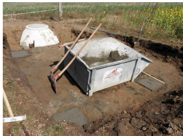
Hier sind die Fundamente für den Container schon mit Beton gefüllt.