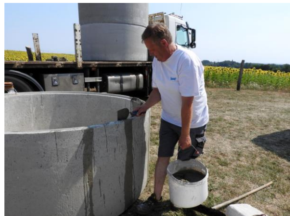
Die Ringe werden angefeuchtet, dann wird der Mörtel auf die Ringe aufgebracht.

Eine gemeinsame Feier auf dem Mühlenberg war deshalb der richtige Abschluss für dieses Teilprojekt beim Wiederaufbau der Greiffenberger Erdholländer-Mühle. Das Wetter spielte mit und steuerte einen wunderbaren Sommerabend bei - kühlender Wind und ein rotleuchtender Sonnenuntergang waren inclusive. #