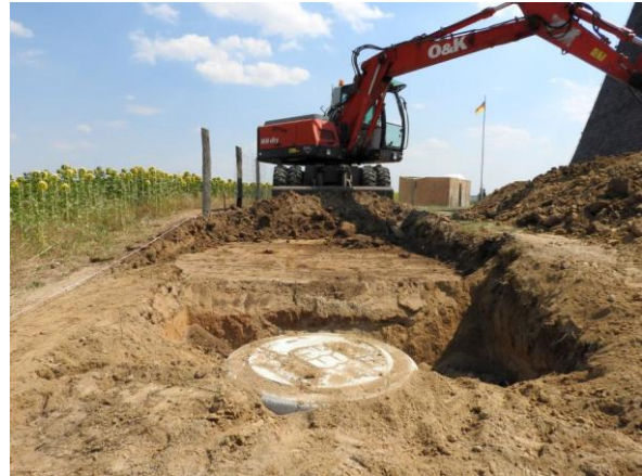
Zum Abschluss dieses Tages wird noch die Standfläche für den Container vorbereitet.