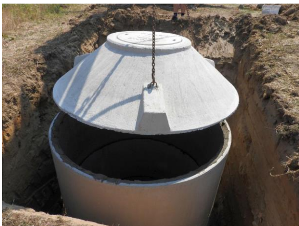
Zum Schluss kommt der Deckel drauf.