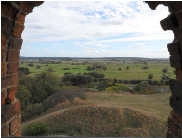
Blick vom Grützpott auf die Oderlandschaft

erwerkes, welches nur wenige Spuren der Verwitterung zeigt. Wir fragen uns, wie lange eine Besatzung im Fall der Belagerung hier hatte aushalten können, denn im Vergleich zu den äußeren Dimensionen und Wandstärken war der Wohnraum doch arg begrenzt. Stellt man in Rechnung, dass es im Belagerungsfall auch üblich war Viehzeug mit in die Burg zu nehmen, so kann man sich die Enge und das Gedränge schon vorstellen. Ein weiteres Problem war sicher das Wasser, denn in der Burg wurde kein Brunnen gefunden. Also konnte man nur Regenwasser speichern.