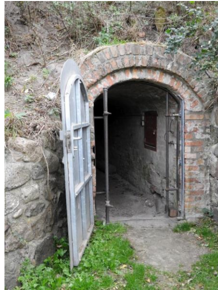
Von hier führt der 1848 angelegte unterirdische Gang in den Turm.

Stedeken Stolp mit allen Zubehörungen und Gerechtigkeiten “ als Lehen hatten. 3 Wer an lokaler Geschichte Interesse hat, dem sei so eine Turmführung empfohlen. #