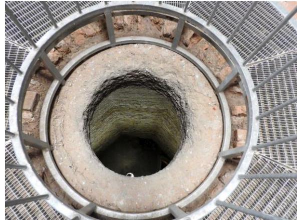
Blick in das sogenannte Angstloch. Der Ringstein bildet den Abschluss des Gewölbes. Das Schutzgeländer ist hier sehr sinnvoll, denn bis zum Boden geht es gut 18 m in die Tiefe.

ganz so stark, so dass der Raum etwa 10 m Durchmesser und 79 m 2 Fläche erreicht. Neben dem Eingang hat er nur wenige Öffnungen zur Außenwelt: eine Lichtöffnung, eine Kaminöffnung, eine Abortöffnung und eine weitere Sichtöffnung.