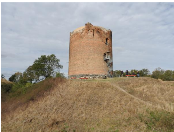
Der Grützpott von Stolpe, die stärkste Turmburg in Brandenburg.

Eine wissenschaftlich stichhaltige Erklärung wurde dafür bisher nicht gefunden, aber es gibt eine schöne Sage, die uns den Namen erklärt (siehe Kasten). Danach griffen die Verteidiger des Turms, als Steine und Pech verbraucht waren, zum Mittagessen aus heißem Grützbrei und schütteten es dem ersten Angreifer auf der Sturmleiter auf den Kopf. Der aber war durch eine Sturmhaube gut geschützt und so konnte die Burg erobert werden.