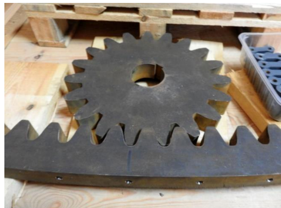
Zahnkranz und Ritzel für den später vorgesehenen Antrieb der Kappe mit Elektromotor. Diese Teile wurden hochgenau mit einer Wasserstrahl-schneidmaschine angefertigt.