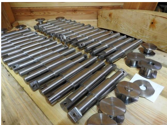
Für den Weihnachtsbaum ein bisschen zu schwer: Die Lagerkugeln und die Achsen.