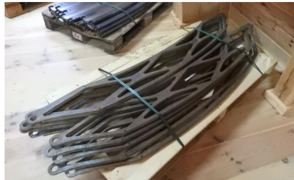
Diese Teile bilden später den Lagerkäfig, an ihnen werden je drei Kugeln befestigt.