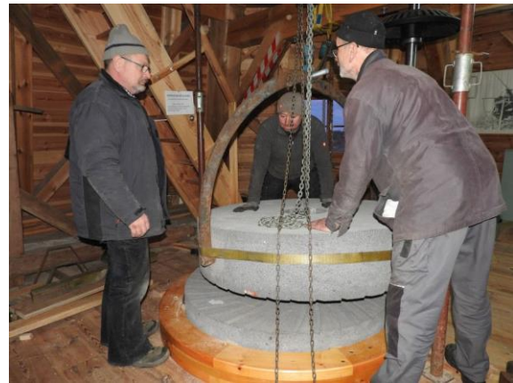
Beim Einbau des Mahlganges im März 2018

Aber auch andere Firmen haben sich um die Mühle große Verdienste erworben, so die Firma EAB Elektroanlagen Schwedt bei der Rekonstruktion des Elektromotors und die Firma RT-Industrieservice, welche die Kugeln und die zugehörigen Achsen für den Drehkranz anfertigte.